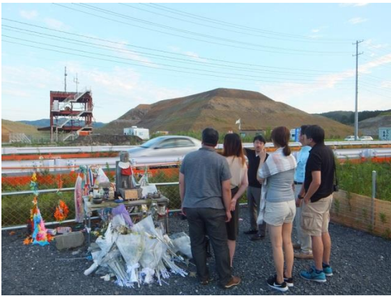
◆ BRT JR 陸前戸倉駅